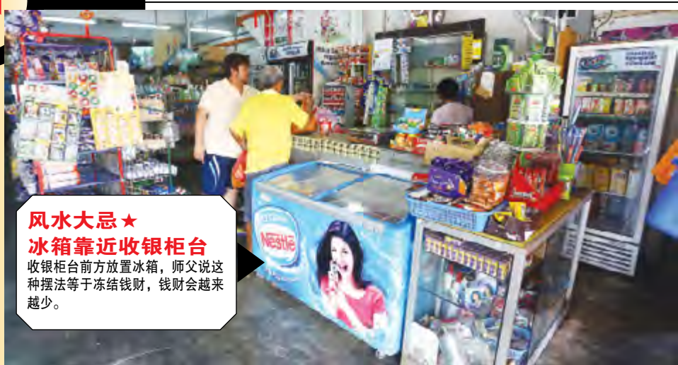
风水大忌★ 冰箱靠近收银柜台 收银柜台前方放置冰箱，师父说这种摆法等于冻结钱财，钱财会越来越少的。