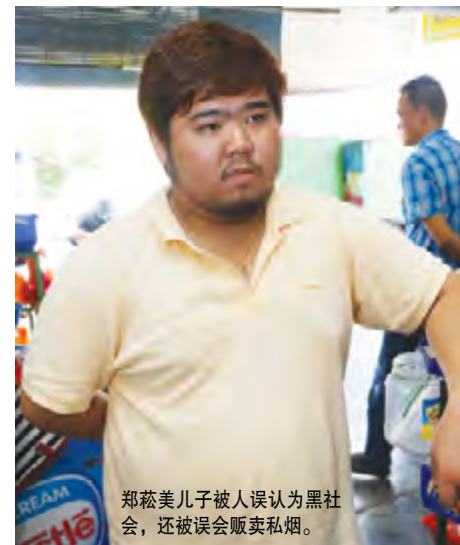
郑蕊美儿子被人误认为黑社会，还被误会贩卖私烟。

“还有，这个桌柜可以修改一下吗？”师父指向大门右方的电话柜台，这个桌的尖角对正杂货店大门，会刺伤在这里的人。“这种尖角也代表口角，形成的煞气会让人多生口角，经常吵架闹不和，只要修饰尖角，人缘就会变好，口角也会跟着减少了。”师父解释。