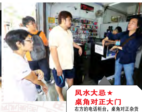
风水大忌★ 桌角对正大门 右方的电话柜台，桌角对正杂货店大门，除了会刺伤这里的人，还容易引发口角。